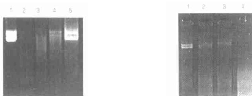
图3 无镁培养后螺旋藻胞内核酸酶对 pEUTISI 的降解情况 Fig.3 Effects of Mg^{2+} -free medium on the activities of endocellular

(A) treated for 16 h and (B) treated for 24 h. Lane1: (control) 2 \mu l pEUTISI; Lane2~7: 2 \mu l pEUTISI + 18 \mu l endocellular nuclease solution from Spirulina platensis which have been treated by 0.2,0.5,1,2,5,10 mmd/L EDTA respectively