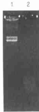
图 1 螺旋藻胞内核酸酶对转化供体质粒 pEUTSI 的降解作用