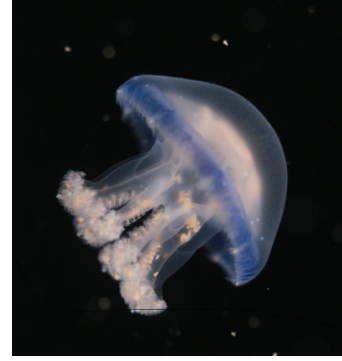
图 3 盐度 32 叶硝水母育成体 Fig. 3 Juveniles in salinity 32

叶硝水母成体在盐度 12、22 和 32 的成活率分别为 79.0%、94.3%和 91.4%(表 3)。水母在盐度 22 条件下伞直径和体质量增长最快, 40 日龄两者分别为 95.89 mm 和 172.30 g, 并且体色和活力最好, 伞直径显著高于盐度 12 和 32 组( P<0.05 ), 体质量极显著高于盐度 12 和 32 组( P<0.01 )。盐度 12 组水母较