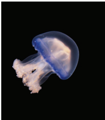
图 2 盐度 22 叶硝水母育成体 Fig. 2 Juveniles in salinity 22

叶硝水母成体在盐度 12、22 和 32 的成活率分别为 79.0%、94.3%和 91.4%(表 3)。水母在盐度 22 条件下伞直径和体质量增长最快, 40 日龄两者分别为 95.89 mm 和 172.30 g, 并且体色和活力最好, 伞直径显著高于盐度 12 和 32 组( P<0.05 ), 体质量极显著高于盐度 12 和 32 组( P<0.01 )。盐度 12 组水母较