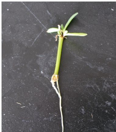
图2 E组海马齿植株形态