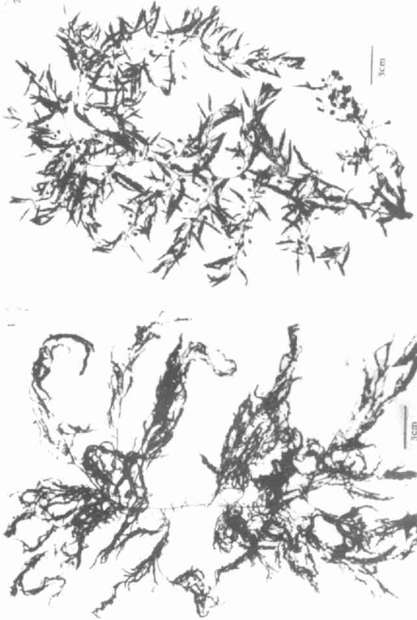
图版 I 线形马尾藻新种 Sargassum capilliforme sp. nov. (1) 和钦州马尾藻新种 Sargassum qinzhouense sp. nov. (2)